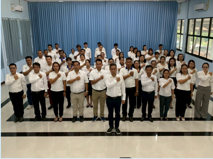
สำนักงานทรัพยากรน้ำที่ 5 จังหวัดนครราชสีมา