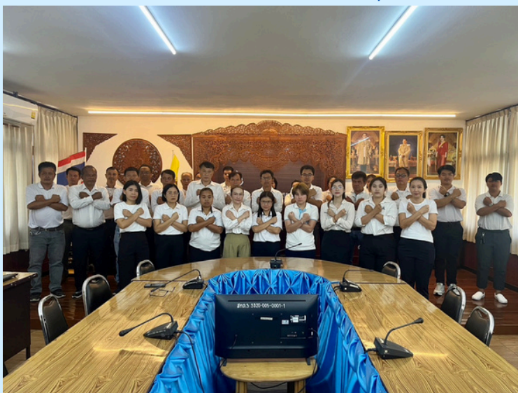
สำนักงานทรัพยากรน้ำที่ 3 จังหวัดอุดรธานี