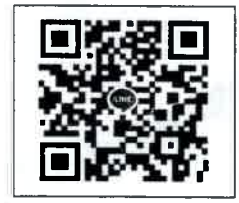
QR-Code เพื่อสอบถามข้อมูล