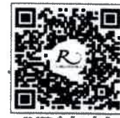
QR CODE สำหรับจองห้องพัก สาขาวิชา วิชาศิลปกรรม

การสำรองห้องพัก ท่านสามารถจองห้องพักกับทางโรงแรมโดยสแกน QR-Code สำหรับจองห้องพัก หากท่านจองห้องพักภายหลังห้องพักอาจเต็มได้ และอาจจะไม่ได้ห้องพักราคาพิเศษ โรงแรมรอยัลริเวอร์ ๒๑๙ ซอยจรัญสนิทวงศ์ ๖๖/๑ แขวงบางพลัด เขตบางพลัด กรุงเทพฯ ๑๐๗๐๐ โทรศัพท์: ๐๒-๔๒๒-๙๒๒๒ โทรสาร : ๐๒-๔๓๓-๕๕๘๐ E-mail : rsvn@royalriverhotel.com