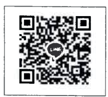
QR-Code เว็บไซต์