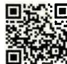
QR-Code เพื่อจองห้องพัก

โทรศัพท์: ๐๒-๔๒๒-๙๒๒๒ E-mail : rsvn@royalriverhotel.com