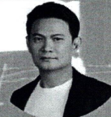
ศ. ดร.สุวิชิต์ สุวรรณสวัสดิ์ อดีตอธิการบดีสถาบันเทคโนโลยี พระจอมเกล้าเจ้าคุณทหารลาดกระบัง

16 - 17 สิงหาคม 2567 ณ ททท. 22 - 24 สิงหาคม 2567 ณ ระยอง และชลบุรี 2 - 7 กันยายน 2567 ณ เครือรัฐออสเตรเลีย 13 - 14 กันยายน 2567 ณ สรูปผล ณ ททท. หรือ ปริมณฑล