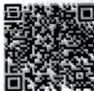
QR Code ใบสมัคร