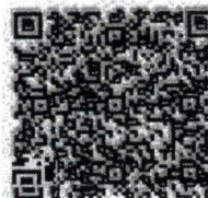
QR Code รายละเอียดหลักสูตรฯ

เรื่องกลับ กสน วันที่ ๒๐ มี.ค. ๒๕๖๘ เวลา 10.45