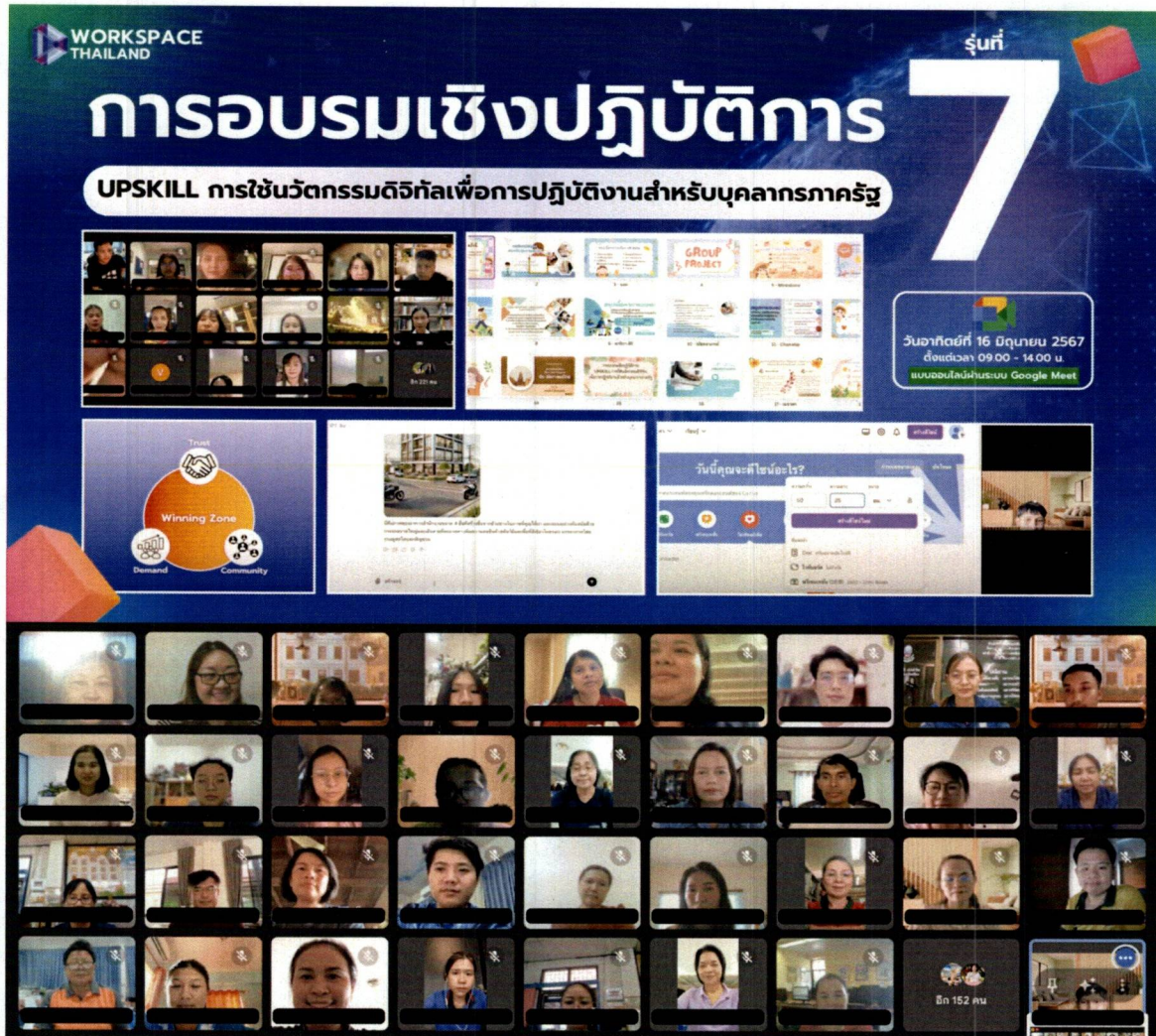
ภาพที่ 1 การอบรมที่ผ่านมามีจัดโดยเวิร์คสเปซ ไทยแลนด์

ภาพถ่ายการอบรมที่ผ่านมามีจัดโดยเวิร์คสเปซ ไทยแลนด์