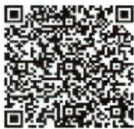
หลักสูตรย่อย ๑๔,๐๐๐ บาท