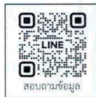
สอบถามข้อมูล