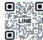
สอบถามข้อมูล