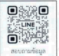
สมัครอบรม