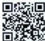
สมัครอบรม