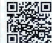
เว็บไซต์