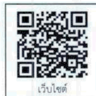
เว็บไซต์