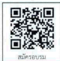
สมัครอบรม