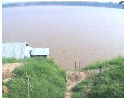
นครพนม - อ.เมือง จ.นครพนม (ลุ่มน้ำโขง)