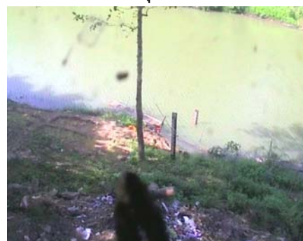
วัดบ้านทุ่งธาตุ - อ.โพธิ์พิสัย จ.หนองคาย (ห้วยหลวง/ลุ่มน้ำโขงอีสาน)

ระดับน้ำปัจจุบัน 156.10 ม.รทก. ระดับตลิ่งต่ำสุด 159.10 ม.รทก. ระดับท่อน้ำ 147.95 ม.รทก.