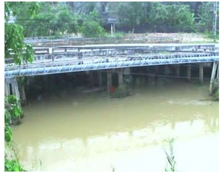
ร.ร.อนุบาลบางสะพาน - อ.บางสะพาน จ.ประจวบคีรีขันธ์ (คลองบางสะพาน/ชายฝั่งทะเลตะวันตก)