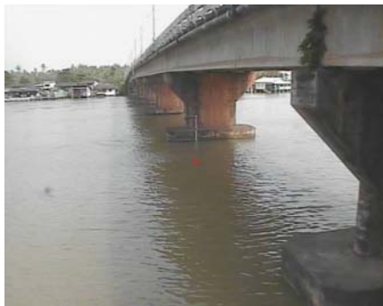
สกอ.เมืองสุราษฎร์ธานี - อ.เมือง จ.สุราษฎร์ธานี (ลุ่มน้ำตาปี)