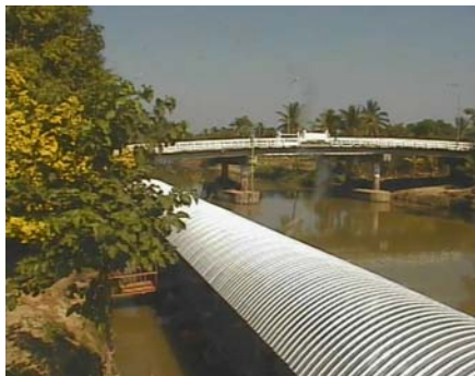
วัดทรงสวย - อ.วัดสิงห์ จ.ชัยนาท (ลุ่มน้ำท่าจีน)