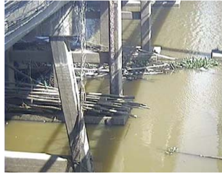
เชิงสะพานบริรักษ์ - อ.เมือง จ.อุทัยธานี (แม่น้ำสะแกกรัง)