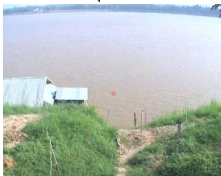
นครพนม - อ.เมือง จ.นครพนม (ลุ่มน้ำโขง)

ระดับน้ำปัจจุบัน 134.68 ม.รทก. ระดับตลิ่งต่ำสุด - ม.รทก. ระดับท่อน้ำ - ม.รทก.