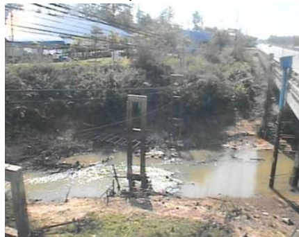
สถานีห้วยหลวง - อ.เมือง จ.อุดรธานี (ลุ่มน้ำโขง)

ระดับน้ำปัจจุบันต่ำกว่าstaff N/A ม.รทก. ระดับตลิ่งต่ำสุด 169.93 ม.รทก. ระดับท่อน้ำ 166.69 ม.รทก.