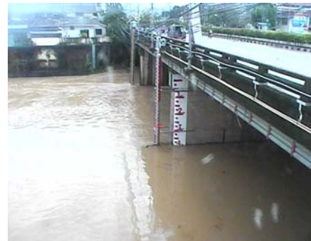
สถานีคลองอู่ตะเภาตอนล่าง - อ.หาดใหญ่ จ.สงขลา (ลุ่มน้ำทะเลสาบสงขลา)