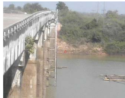
สถานีปากอูน - อ.ศรีสงคราม จ.นครพนม (ลุ่มน้ำโขง)

ระดับน้ำปัจจุบัน 133.99 ม.รทก. ระดับตลิ่งต่ำสุด 158.22 ม.รทก. ระดับท่อน้ำ 149.84 ม.รทก.