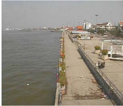
ศาลากลางสมุทรปราการ - อ.เมือง จ.สมุทรปราการ (ลุ่มน้ำเจ้าพระยา)