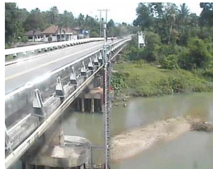
สถานีคลองนาท่อม - อ.เมือง จ.พัทลุง (ลุ่มน้ำทะเลสาบสงขลา)