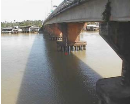
สกอ.เมืองสุราษฎร์ธานี - อ.เมือง จ.สุราษฎร์ธานี (ลุ่มน้ำตาปี)