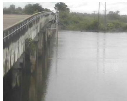
สถานีปากอูน - อ.ศรีสงคราม จ.นครพนม (ลุ่มน้ำโขง)