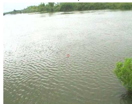
บ้านท่าสะอาด - อ.เขกา จ.บึงกาฬ (แม่น้ำสงคราม/ลุ่มน้ำโขง)