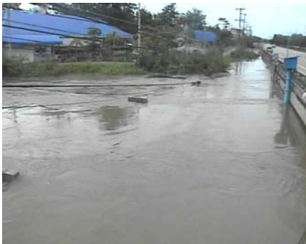
สถานีห้วยหลวง - อ.เมือง จ.อุดรธานี (ลุ่มน้ำโขง)

บ้านตาลปากน้ำ อ.ท่าอุเทน จ.นครพนม (ลุ่มน้ำโขงอีสาน) สถานการณ์น้ำปกติ บ้านเหล่านกขุม อ.เมือง จ.ขอนแก่น (ลุ่มน้ำชี) สถานการณ์น้ำปกติ บ้านหาดเสลา อ.แก้งลำยอง จ.นครสวรรค์ (ลุ่มน้ำปิง) สถานการณ์ฝักระวังน้ำท่วม วัดเกาะวาลุการาม อ.เมือง จ.ลำปาง (ลุ่มน้ำวัง) สถานการณ์น้ำปกติ บ้านทับกฤช อ.ชุมแสง จ.นครสวรรค์ (ลุ่มน้ำน่าน) สถานการณ์น้ำท่วม ร.ร.อนุบาลบางสะพาน อ.บางสะพาน จ.ประจวบคีรีขันธ์ (คลองบางสะพาน/ลุ่มน้ำชายฝั่ง ทะเลตะวันตก) สถานการณ์น้ำปกติ บ้านท้ายดง อ.สามโคก จ.ปทุมธานี (ลุ่มน้ำเจ้าพระยา) สถานการณ์ฝักระวังน้ำท่วม นาท่อม อ.เมือง จ.พัทลุง (ลุ่มน้ำทะเลสาบสงขลา) สถานการณ์น้ำน้อย