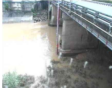
สถานีคลองอู่ตะเภาตอนล่าง - อ.หาดใหญ่ จ.สงขลา (ลุ่มน้ำทะเลสาบสงขลา)