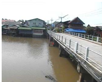
สถานีลำป่า - อ.เมือง จ.พัทลุง (ลุ่มน้ำทะเลสาบสงขลา)