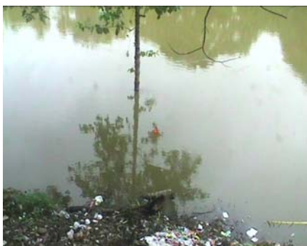
วัดบ้านทุ่งธาตุ - อ.โพนพิสัย จ.หนองคาย (ห้วยหลวง/ลุ่มน้ำโขงอีสาน)