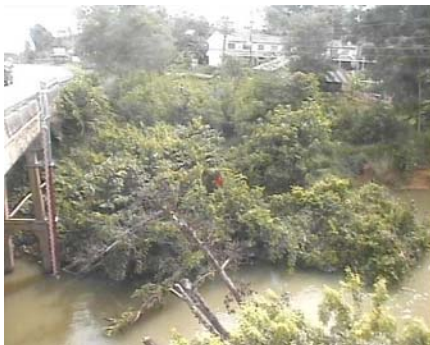
สถานีคลองตะโหมด - อ.ตะโหมด จ.พัทลุง (ลุ่มน้ำทะเลสาบสงขลา)