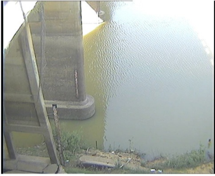
สถานีมหาชนะชัย จ.ยโสธร (แม่น้ำชี)

ระดับน้ำ 115.52 ม.รทก. (น้ำปกติ) EC - mS/cm pH -