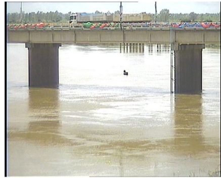
สถานีราชสีไศล จ.ศรีสะเกษ (แม่น้ำมูล)