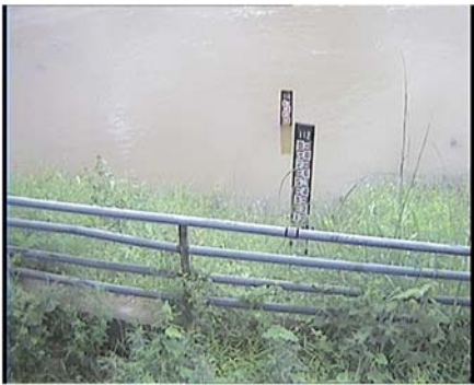
สถานีแก่งสะพือ จ.อุบลราชธานี (แม่น้ำมูล)

ระดับน้ำ 107.16 ม.รทก. (น้ำปกติ) EC 0.01 mS/cm pH 6.92