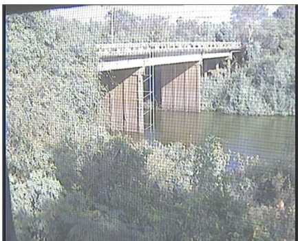
สถานีเขื่อนโน จ.อุบลราชธานี (ลำเซบาย)