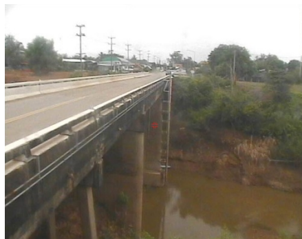
สถานีห้วยโสม จ.อุตรราชธานี (แม่น้ำโขง)