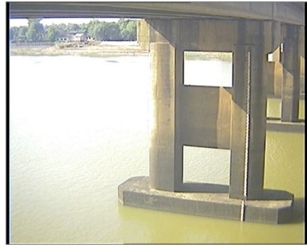
สถานีอุบลราชธานี จ.อุบลราชธานี (แม่น้ำมูล)

ระดับน้ำ 107.16 ม.รทก. (น้ำปกติ) EC 0.01 mS/cm pH 6.92