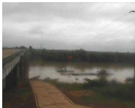
สถานีปากอูน จ.นครพนม (แม่น้ำโขง)