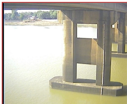
สถานีอุบลราชธานี จ.อุบลราชธานี (แม่น้ำมูล)

ระดับน้ำ - ม.รทก. (น้ำน้อย) EC - mS/cm pH -