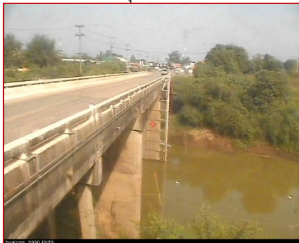
สถานีห้วยโสม จ.อุตรราชธานี (แม่น้ำโขง)