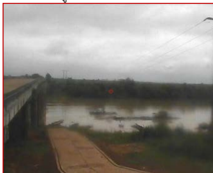
สถานีปากอูน จ.นครพนม (แม่น้ำโขง)