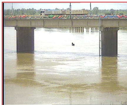
สถานีราษีไศล จ.ศรีสะเกษ (แม่น้ำมูล)