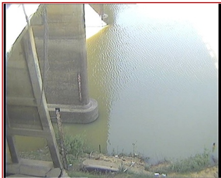
สถานีมหาชนะชัย จ.ยโสธร (แม่น้ำชี)

ระดับน้ำ - ม.รทก. (น้ำน้อย) EC - mS/cm pH -