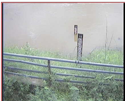
สถานีแก่งสะพือ จ.อุบลราชธานี (แม่น้ำมูล)

ระดับน้ำ - ม.รทก. (น้ำน้อย) EC - mS/cm pH -