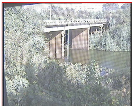
สถานีเชียงโน จ.อุบลราชธานี (ลำเซบาย)