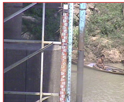
สถานี สตึก จ.บุรีรัมย์ (แม่น้ำมูล)

ระดับน้ำ - ม.รทก. (น้ำน้อย) EC - mS/cm pH -