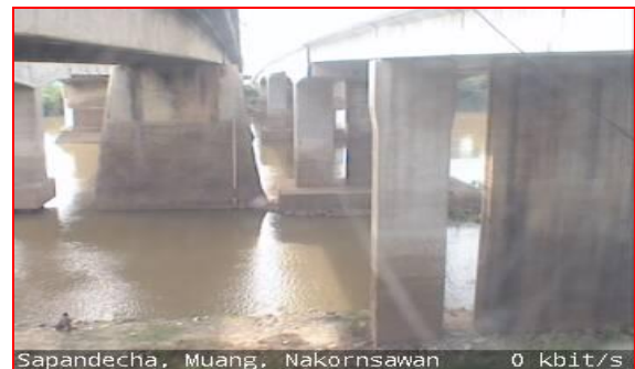
สถานีสะพานเดชาติวงศ์ ต.ปากน้ำโพธิ์ อ.เมือง จ.นครสวรรค์ (ลุ่มน้ำเจ้าพระยา)