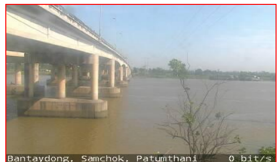
สถานีบ้านท้ายดง ต.บางกระบือ อ.สามโคก จ.ปทุมธานี (ลุ่มน้ำเจ้าพระยา)