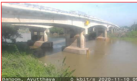
สถานีบ้านป้อม ต.บ้านป้อม จ.พระนครศรีอยุธยา (ลุ่มน้ำเจ้าพระยา)