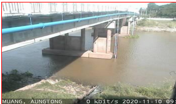
สถานีศาลากลางอ่างทอง ต.บางแก้ว อ.เมือง จ.อ่างทอง (ลุ่มน้ำเจ้าพระยา)