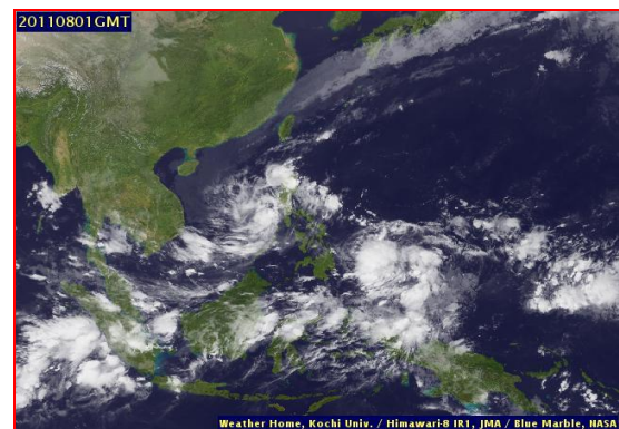
ภาพถ่ายจากดาวเทียม วันที่ 10 พ.ย. 2563