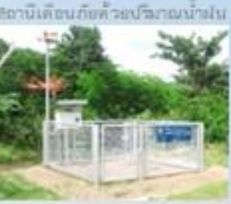
สถานีเตือนภัยด้วยป้ายบอกน้ำฝน