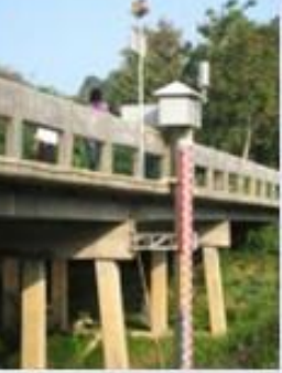
สถานีเตือนภัยด้วยป้ายบอกน้ำฝนและระดับน้ำ