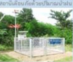
สถานีเตือนภัยด้วย ปริมาณน้ำฝนและระดับน้ำ